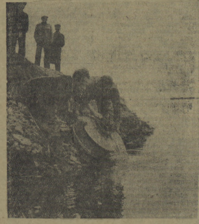
Tereny objęte opieką Związku Wędkarskiego są planowo zarybiane.

Początek seansów we wszystkich kinach o godzinie 16, 18 i 20. W niedzielę i święta o godzinie 12, 14, 16, 18 i 20, poranki o godz. 10.