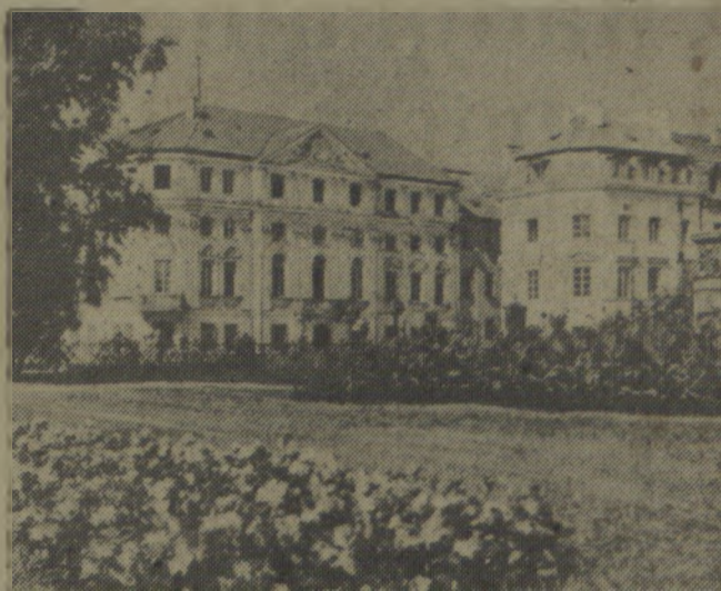
Na zdjęciu: Fragment Krakowskiego Przedmieścia — widok ze skweru przy pomniku Mickiewicza.