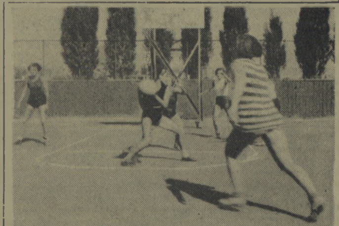
Przeszło 200 zawodniczek i zawodników CWKS bierze udział w obozie kondycyjnym przed Spartakiadą, zorganizowanym w Warszawie. Na zdjęciu: na kortach CWKS-u trenują koszykarki.

Na zdjęciu: bramkarz „Dynamo” (Tyflis) wyla puje strzał napastnika CDSA, w czasie spotkania między tymi zespołami.