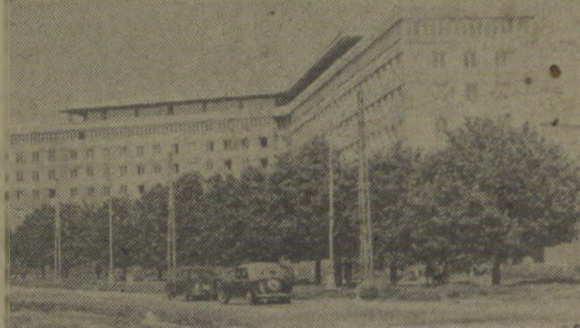
W Warszawie obok nowych zakładów przemysłowych, wielkich nowoczesnych dzielnic mieszkaniowych buduje się dziesiątki budynków, gdzie znajdują się pomieszczenia centralne biura, urzędy i instytucje.