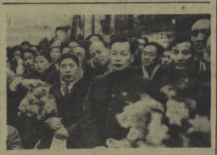
Grupa delegatów chińskich, która przybyła do Warszawy na II Światowy Kongres Obrońców Pokoju.

Wszystkim delegacjom zgotowano serdeczne, owacyjne powitanie. Na lotnisku długo nie milkły okrzyki na cześć II Światowego Kongresu Obrońców Pokoju i na cześć przybywających delegatów