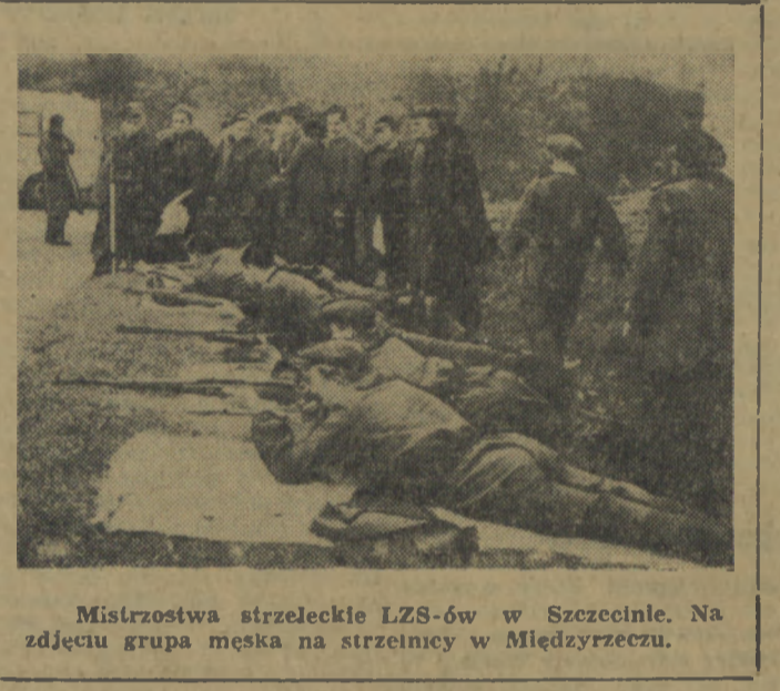
Mistrzostwa strzeleckie LZS-ów w Szczecinie. Na zdjęciu grupa męska na strzelnicy w Międzyrzeczu.

ich życzeniem, do następujących Zrzeszeń Sportowych: Do ZS Unia; Zw. Zaw. Prac. Przem. Poligraficznego, Dziennikarzy, Służby Zdrowia. Do ZS Kolejarz; Zw. Zaw. Prac. Poczt i Telekom., Zw. Zaw. Transportowców.