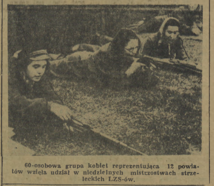
60-osobowa grupa kobiet reprezentująca 12 powiatów wzięła udział w niedzielnych mistrzostwach strzeleckich LZS-ów.