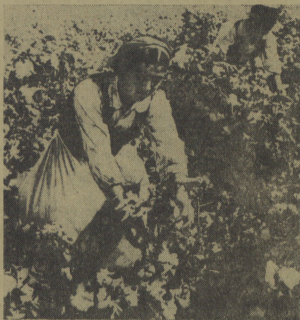
Podstawowym bogactwem Uzbekistanu jest bawełna

„Zjednoczenie ziem uzbeckich w jedną republikę — pisał w r. 1925 Józef Stalin — stanowi akt o ogromnym znaczeniu dla całego Wschodu.”