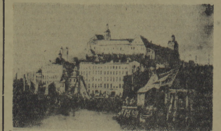
Jak widzimy na starej ilu straszy, brzegi Odry były dawniej gęsto zabudowane. U stóp zamku królewskiego koncentrowało się życie portu, w którym gromadziły się łodzie i statki.