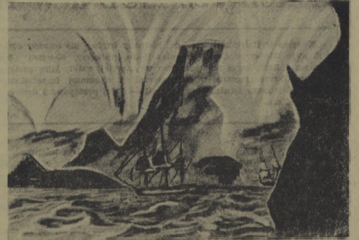
Zorza południowa. Według rysunku P. N. Michajłowa, uczestnika ekspedycji do biegu na południowego.

Początki fizyki morza sięgają XVIII wieku, ale dopiero w ostatnich latach notuje się właściwy rozwój tej galei wiedzy. Na polu badań właściwości fizycznych morza fizycy radzieccy wysunęli się na czołowe miejsce wśród uczonych