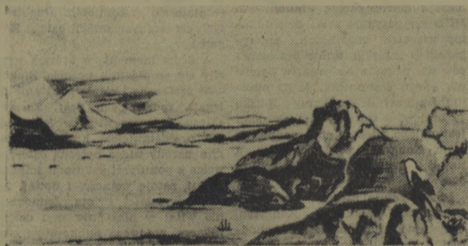
Fragment wybrzeży Ziemi Ognistej.