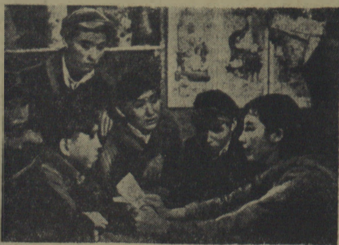
Scena z filmu „Czao” produkcji chińskiej